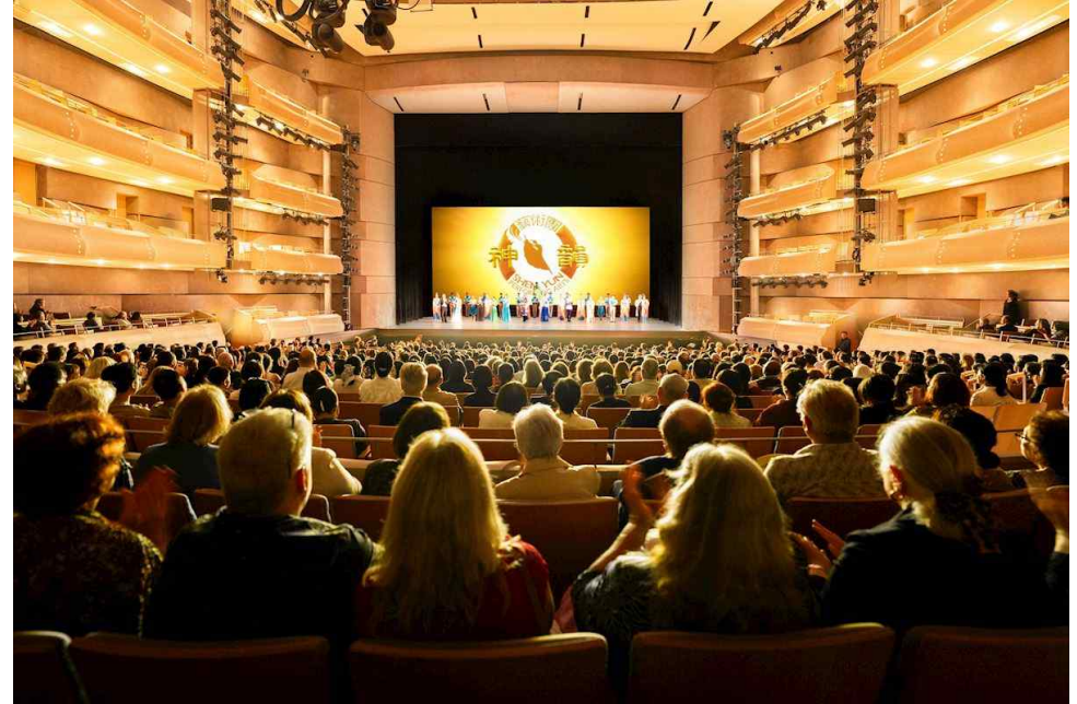
2026년 6월 25일 저녁, 우여곡절 끝에 포시즌스 공연예술센터에서 만원사례를 이룬 선원뉴욕예술단의 첫 공연 모습